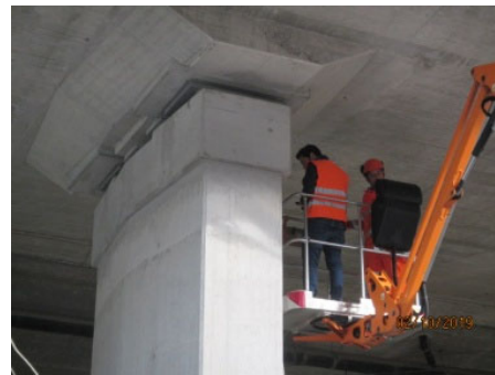
Inspection du pont P0811 Lizerne-Seba au moyen d'une nacelle pour contrôle des appuis